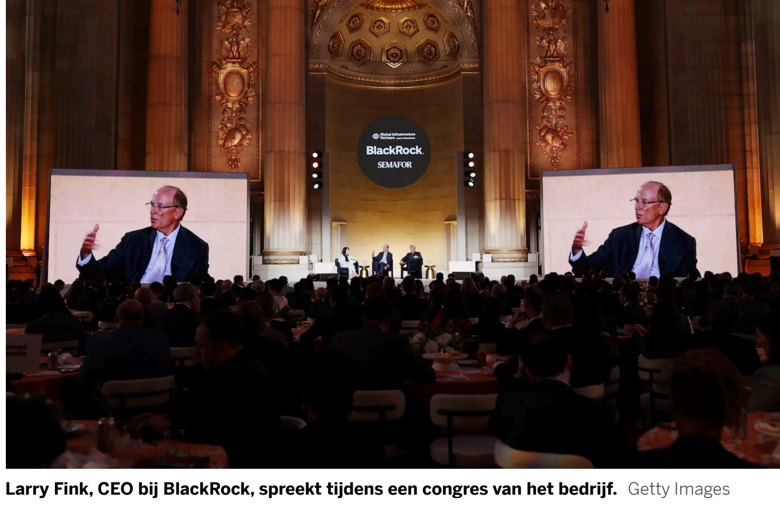
Larry Fink, CEO bij BlackRock, spreekt tijdens een congres van het bedrijf.

Het Amerikaanse BlackRock, grootste vermogensbeheerder ter wereld, claimt een neutrale partij te zijn. Maar dat is allesbehalve waar.